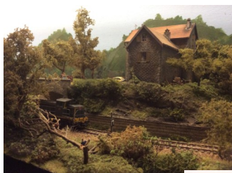
Le « Mas »