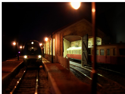
Gare de Cadillan.

Contactez-nous par téléphone, courrier ou E-mail, pour connaître nos disponibilités, nos services et prestations pour votre événement.