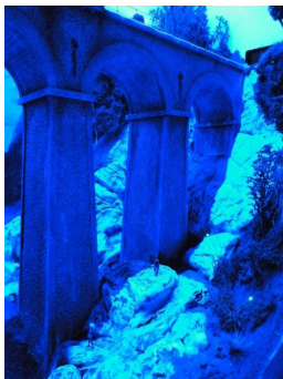
Le Viaduc de la « Grande Combe » ambiance nocturne