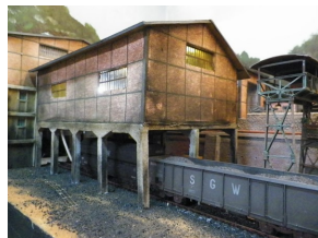
Le carreau minier